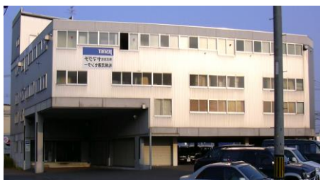
玩具流通センター