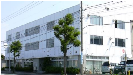
オフィスビル増築工事