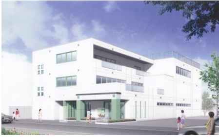
某宗教法人系列幼稚園