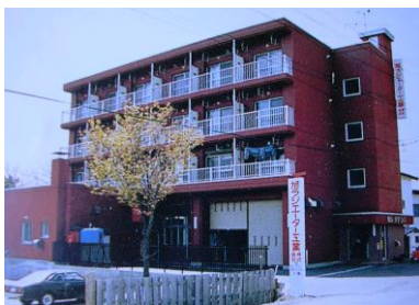
賃貸マンション・工場事務所