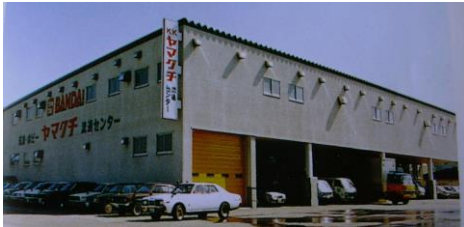
玩具流通センター