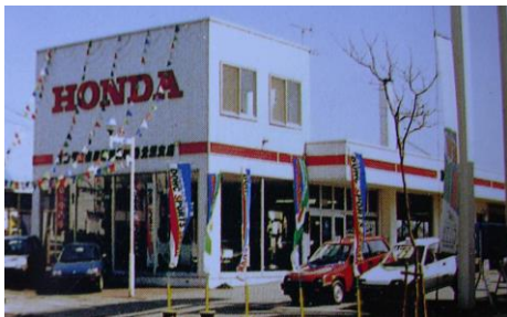
車ディーラー営業所