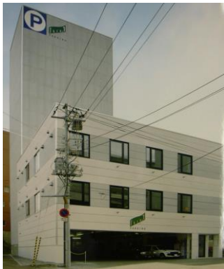
立体駐車付オフィス