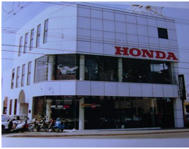
車ディーラー社屋