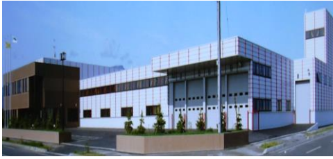
包装紙器本社工場